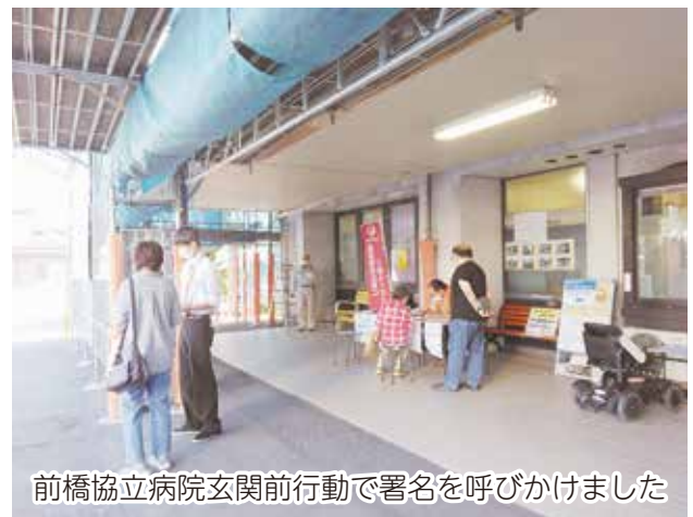
前橋協立病院玄関前行動で署名を呼びかけました

療・介護従事者、患者、共同組織、地域のみなさんと手をつないで、次の行動、次の前進を」と、署名活動を通して得られた確信の言葉が語られました。今国会では、OTC類似薬の自己負担増や高額療養費の負担限度額引き上げなどが審議されています。受療権も医療機関も守るために、これからもコツコツと声をあげていきましょう。