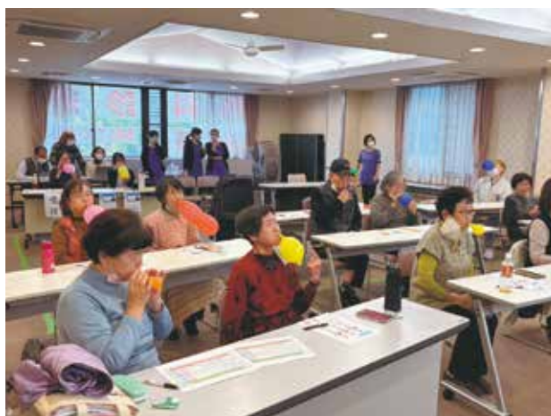
風船膨らませ訓練

オーラルフレイルは、お口の健康への無関心から始まります。些細なことから始まるため、オーラルフレイルチェックなどで、予防をしていくことが大切です。