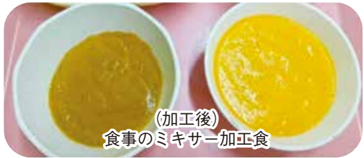
(加工後) 食事のミキサー加工食

本人と家族の不安に寄り添って 「皆さんの生活に寄り添いながら、その人らしい生活をサポートする」を掲げ、在宅で栄養相談が必要な方やその家族の方は、「手軽に力ローリーを摂れる方法を知りたい」「水分を摂るときにむせやすくなる不安」「何を食べていい」「なんとなく痩せてきた気がする」など自宅での生活に不安をかかえている方が多いです。そのような方々が、私たち管理栄養士と話をすることで、少しでも安心して自宅での生活を送ることができるようになります。