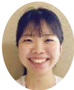
前橋協立病院 管理栄養士

ていきます。例えば、食事が段々食べられなくなったり、痩せてきてしまった方には少量で高カロリーなレシピの提案を行います。歯がなくて食事が食べられないという方にも食品に水分を加えて、ミキサーやプロセッサを使いペースト状にした食事をおすすめしたりします。