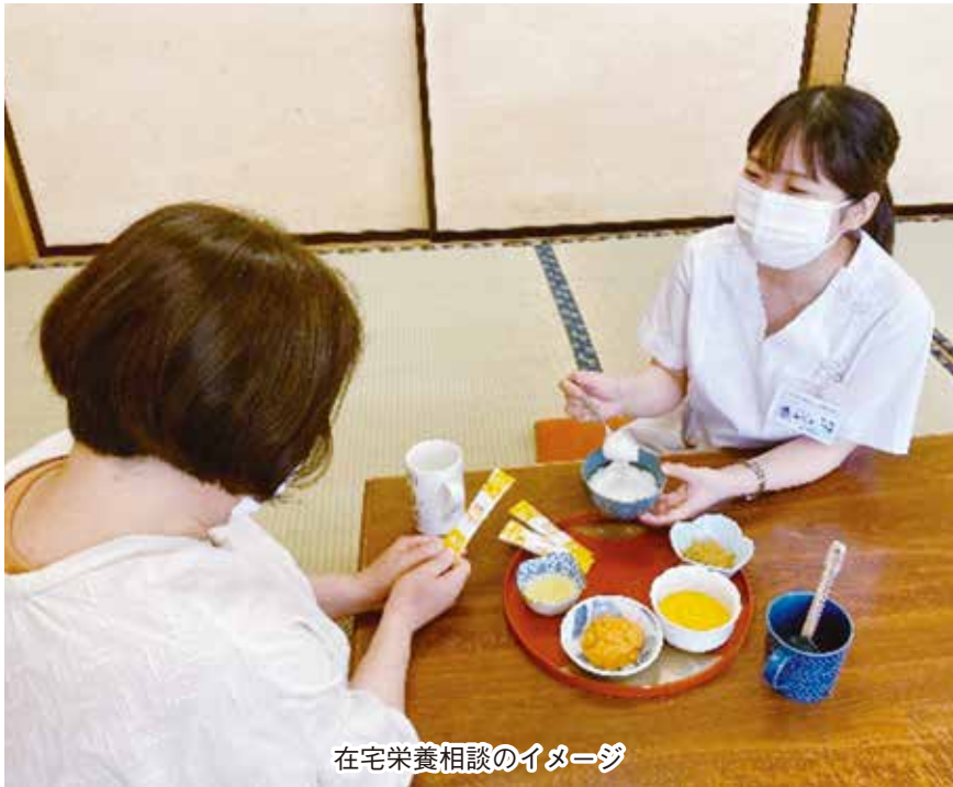
在宅栄養相談のイメージ