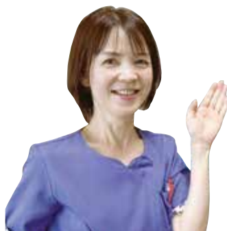
協立歯科クリニック 歯科衛生士長