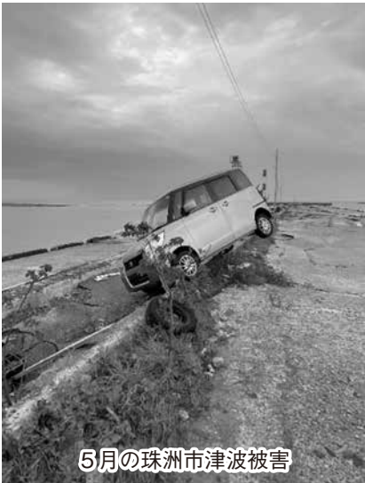
5月の珠州市津波被害