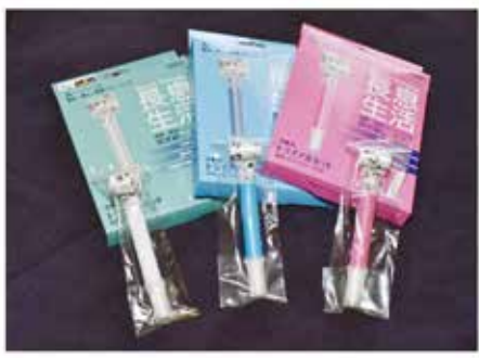
▲白がレベル0、青がレベル2、赤がレベル1、一箱3本入り

腹式呼吸を促して呼吸力や腹筋の強化が期待できます。それだけでなく、口元の筋肉トレーニング（口腔機能改善）も兼ねており、オーラルフレイル予防や誤嚥予防にも繋がります。ダイエット効果、美容にも良いとされています。「長息生活」（販売元：株式会社ルピナス）という大人のトレーニング用の吹き戻しもあります。皆さんも自分のレベルに合わせた吹き戻しを使って、呼吸やお口のトレーニング…いかがでしょうか？