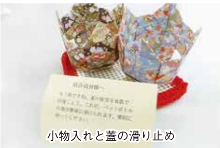
小物入れと蓋の滑り止め