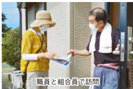
職員と組合員で訪問

先日、医療生協の職員が運営委員に書類を届けに行った際、ちょうど出かけるところを引くとめると、「〇〇さん体調が悪いから様子を見に行くんだよ」と言うのです。心配なので同行すると、歩行も困難で意識朦朧状態。急いで訪問看護たんぼぼに連絡し看護師に来てもらい、救急車で搬送されました。早めの対応のおかげで大事にはいたらなかったようですが、地域の運営委員さんとのつながりの大切さを実感しました。