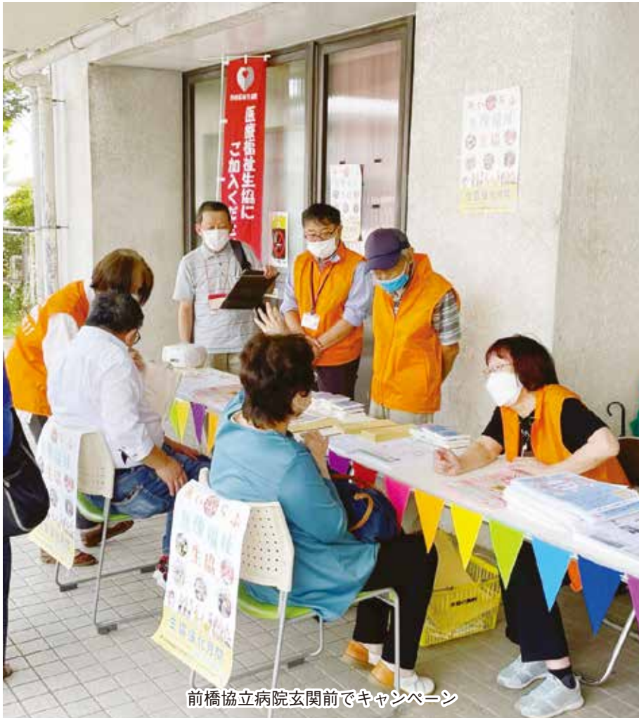
前橋協立病院玄関前でキャンペーン