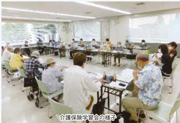
介護保険学習会の様子

邑楽館林ブロックでは、今後もウォーキング企画や原発についての学習会などを計画しています。