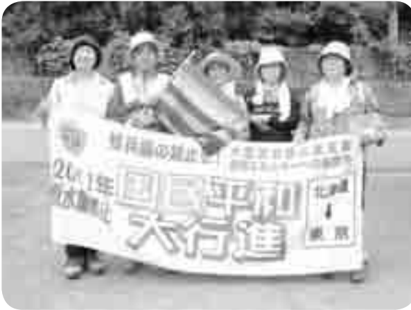
群馬でのメインコースは、碓氷峠からスタート! 大泉千代田支部・上川支部のみなさん

インコース以外に県内各地で網の目行進も行われました。群馬中央医療生協からも行進参加・休憩接待・出迎えなどに約160名の組合員・職員が参加し、平和