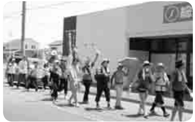
前橋から伊勢崎に向う

今月開催される原水爆禁止世界大会へ群馬中央医療生協から組合員2名、職員4名の代表者が参加することになりました。参加にあたり署名・カンパや千羽鶴作りなどの取りくみに多くの組合員さん・患者さん・職員のご協力をいただきました。